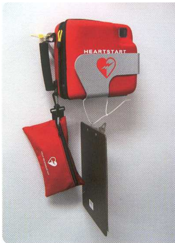
1 : Défibrillateur Externe Automatisé (AED)

D'autres matériels comme le masque de poche, la planche ou le collier cervical seront présentés ultérieurement.