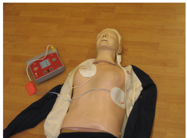
3 : AED placé sur la poitrine d'une victime

La défibrillation doit donc être réalisée le plus tôt possible (endéans les 5 minutes depuis le début de l'intervention) et en ce sens, elle fait partie intégrante de la chaîne de survie.