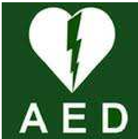
5 : Logo officiel de la défibrillation

Un défibrillateur placé judicieusement dans vos installations et utilisable par un grand nombre (personnel de surveillance, administratif, de maintenance, encadrement club, et autres gestionnaires d'asbl sportives) sera une garantie supplémentaire et indiscutable pour la sécurité de vos usagers.