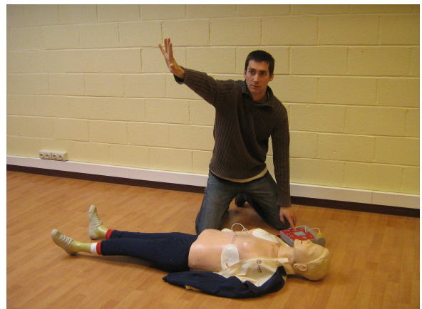
5 : Utilisation d'un AED

Dans notre domaine sportif, où l'encadrement est existant, souvent professionnel et possède en général des aptitudes de secourisme ; nous continuons à privilégier et promouvoir la défibrillation semi-automatisée.